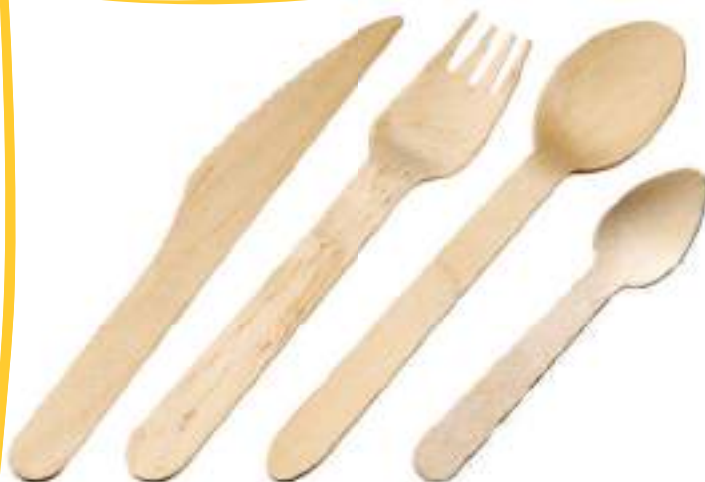
COUVERTS BOIS Wood cutlery