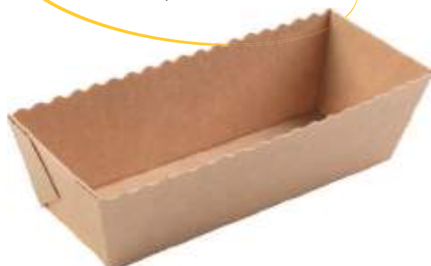
17989 - MOULE CAKE DE VOYAGE KRAFT P/30 7.77 € Fond 160 x 55 mm - Bord 185 x 80 x h 50 mm - 50 cl Kraft cake

Moules en carton micro-canelures, idéaux pour les cakes salés ou sucrés à partager Atout : couleur pour un rendu naturel