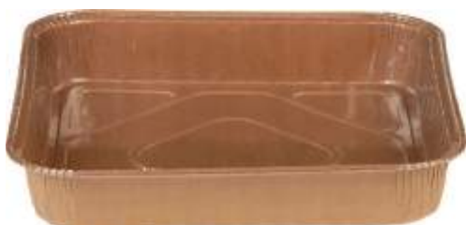
17944 - MOULE DE CUISSON CARRÉ P/50 16.20 € 175 x 175 x h 30 mm Square paper mould