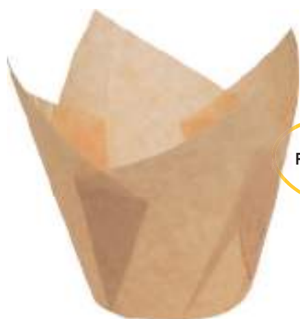
PAPIER INGRAISSABLE -40°C +230°C