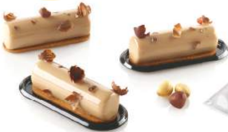
11311 - 12 MINI CYLINDRES 14.64 € 78 x 21.5 x h 21.5 mm - 30 ml 12 small cylinders