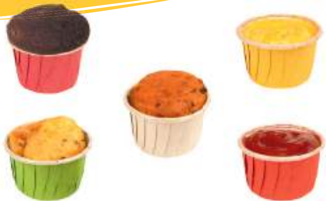
17966 - CAISSETTE CUISINE COULEUR PM P/250 19.72 € 5 couleurs assorties, avec film ingraissable Ø 47 mm - Ø fond 38 x h 30 mm Colored baking cups with grease proof film