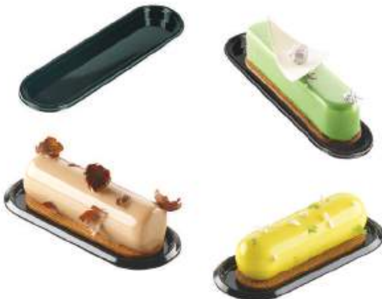
11303 - MINI COUPELLES OVALES PLASTIQUE NOIRES P/100 24.18 € 102 x 42 x h 5 mm Small black oval, plastic tray Pour moules 11294 / 11309 / 11311