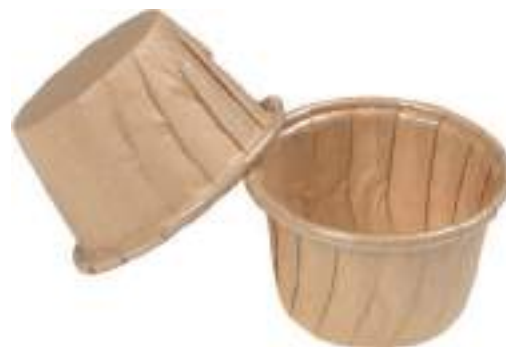
CAISSETTE CUISINE ÉCRUE Avec film ingraissable Ecru baking cups with grease proof film