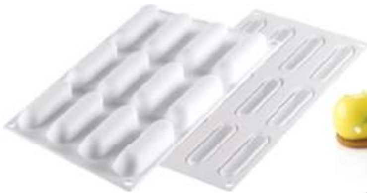
11309 - 12 MINI FINGERS 14.64 € 80 x 22 x h 22 mm - 30 ml 12 small fingers