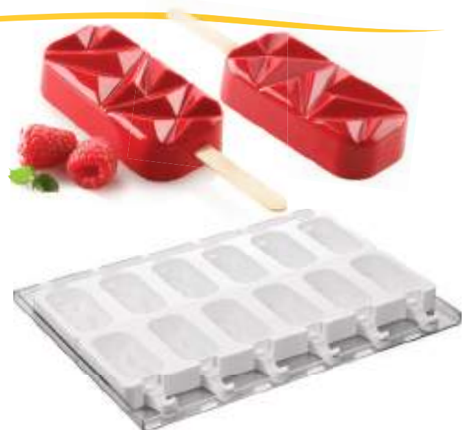
14857 - 12 MOULES SHOCK 45.74 € 92 x 47 x h 25 mm - 80 ml 12 shock moulds Moule silicone livré avec plaque support 40 x 30 cm + 50 batonnets bois ● Pour utilisation froide (glaces) et chaude (gâteaux)